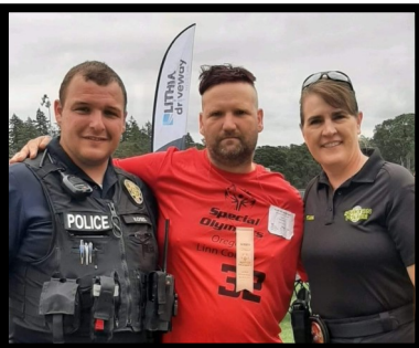
Special Olympics Regional Track and Field Competition